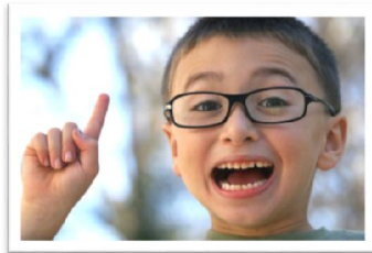
Υπόδειξη με σαφήνεια & συντομία

Σιγουρευτείτε ότι η εντολή που δίνετε στο παιδί σας γίνεται κατανοητή από το ίδιο. Προσπαθήστε να είστε σύντομοι και σαφείς και μη διστάσετε να επαναλάβετε την εντολή αρκετές φορές αν χρειαστεί, με διαφορετικά λόγια εάν το παιδί δείχνει να μην καταλαβαίνει.