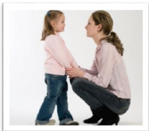
Κρατήστε το παιδί σταθερά